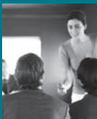
Diskussionsteilnehmer: vorherige Referenten

11.30 Uhr | Barrieren gegen die Migration von Substanzen in Lebensmitteln. Erweiterung des Begriffes der Schutz- funktion von Lebensmittelverpackungen am Bsp. von Barrierematerialien gegen Mineralölmigration.