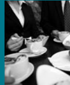
14.45 Uhr | Kaffeepause